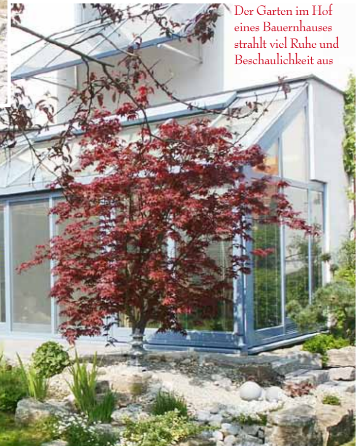
Der Garten im Hof eines Bauernhauses strahlt viel Ruhe und Beschaulichkeit aus