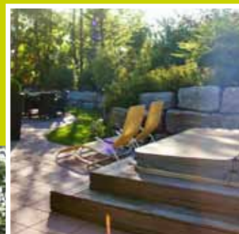
Whirlpool, Gartendusche, Ruheoase oder Kommunikationszentrum an der Outdoor-Küche. Die Nutzungsmöglichkeiten des Gartens sind heute vielfältig