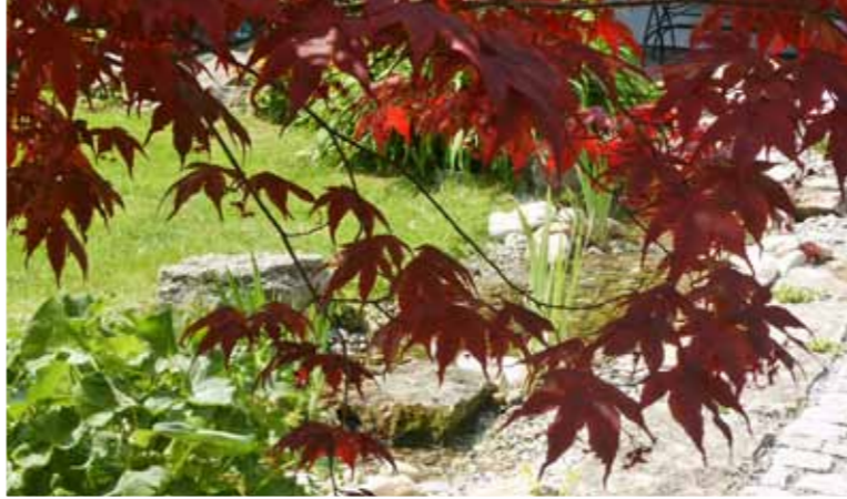
Der Rote Fächerahorn ist mit seinem intensiv gefärbten Laub ein attraktiver Blickfang und zugleich ein wirksamer Sichtschutz vor dem Wintergarten

„Erst sehen, was sich machen lässt. Dann machen wir, was sich sehen lässt!“