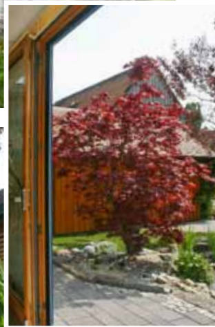
Asiatische Details wecken kein Fernweh sondern schaffen zuhause perfekte Urlaubsatmosphäre