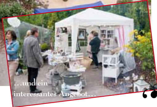
...und ein interessantes Angebot...