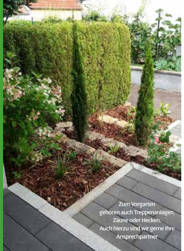
Zum Vorgarten gehören auch Treppenanlagen, Zäune oder Hecken. Auch hierzu sind wir gerne Ihre Ansprechpartner

Nachbarn, Besucher, Passanten: sie alle nehmen die Visitenkarte eines Hauses, den Vorgarten, wahr. Er ist der Ausdruck unserer Persönlichkeit. Eine kreative Vorgartengestaltung kann attraktiv, umwelt- und bienenfreundlich sein, Beschattung im Sommer bieten und zu einem Plausch unter Nachbarn einladen und ganz nebenbei einen Prestigegewinn mit sich bringen. Dies hat nichts mit den immer mehr in Mode kommenden versteinerten Vorgärten gemeinsam. Das Hauptargument für diese Gärten wird in der Pflegefreundlichkeit gesehen. Der BGL, unser Bundesverband Garten- Landschafts- und Sportplatzbau e.V., hat 2017 eine Studie in Auftrag gegeben, die das Phänomen der versteinerten Vorgärten untersucht hat. Interessant ist, dass selbst die Besitzer solcher Kies/Steinvorgärten mit Pflanzen gestaltete Vorgärten als schöner bewerten. Man sollte auch nicht den Wert des Vorgartens für die Hausbewohner selbst unterschätzen. Mindestens zweimal am Tag können wir durch einen Garten gehen, der uns beglückt, die Jahreszeiten erleben lässt und damit unsere Lebensqualität verbessert. Jeder von uns hat es in der Hand, wie er sein Leben bereichert.