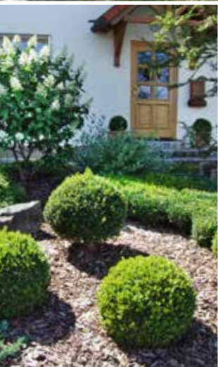
Die kleine Galerie von uns gestalteter Vorgärten zeigt die Bandbreite der Möglichkeiten von geometrisch streng bis zur naturnahen Bienenweide