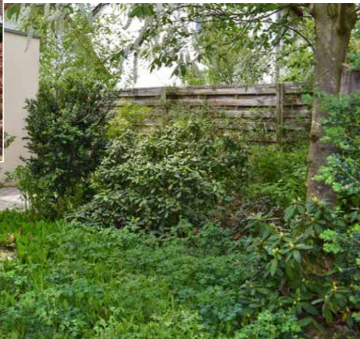
Rhododendren und Maiglöckchen – kurz vor dem Aufblühen