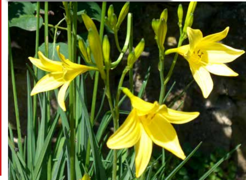
Taglilien gibt es in vielen Farben. Die hübschen Blüten sind übrigens essbar!