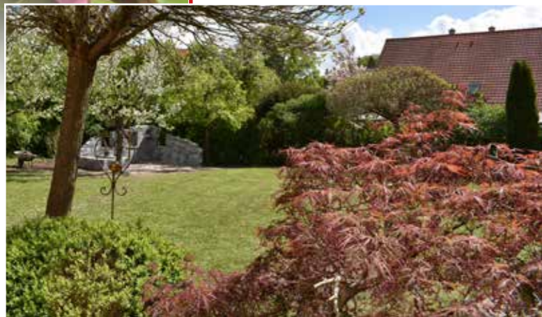
Die Ruine am Rand des Gartens bildet einen besonders attraktiven Blickfang

Im Bereich der alten Apfelbäume und der Eiche haben wir eine Ruine geschaffen, die nun als Sonnenterrasse für die späten Nachmittagsstunden dient. Es wurden kleine Nischen für Windlichter gebaut, sowie ein Hochbeet und ein Beet direkt am Sitzplatz, damit man sozusagen inmitten der Pflanzung sitzen kann. Hier kann man bei einem Buch die Welt vergessen oder abends den Tag ausklingen lassen.