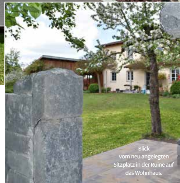
Blick vom neu angelegten Sitzplatz in der Ruine auf das Wohnhaus.