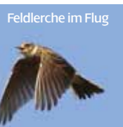
Feldlerche im Flug