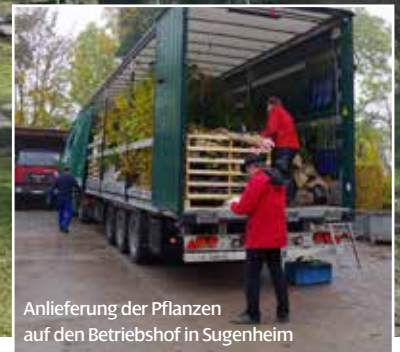
Anlieferung der Pflanzen auf den Betriebshof in Sugenheim