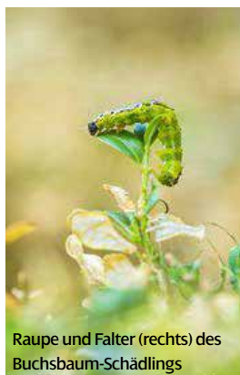
Raupe und Falter (rechts) des Buchsbaum-Schädling